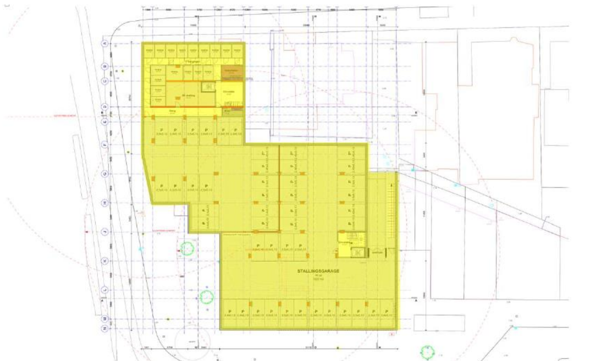
Figuur 1. Parkeervoorziening winkelhart west

In figuur 1 is de voorgestelde parkeervoorziening weergegeven. Wij hebben geen bezwaren tegen de voorgenomen omvang van de parkeervoorziening. Wel vinden we dat de parkeervoorziening aan zou moeten sluiten bij het algemene parkeerbeleid van de gemeente.