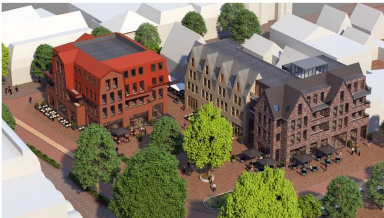
Figuur 5. Plannen zoals weergegeven op de website

Er zal ongetwijfeld discussie ontstaan over de korrelgrootte van Bergen en een voldoende open structuur in het winkelhart. De definitieve ontwerpen zullen een antwoord moeten geven of een 'dwaalgevoel' in het gebied opgeroepen kan worden. Datzelfde geldt voor de te ontwikkelen winkel- en horeca-activiteiten. We gaan ervan uit dat de bestaande activiteiten deels terugkomen en dat de horeca vooral aan de Breelaan zijde van het Plein zal worden gerealiseerd. De huidige weergaven geven een beeld van een tamelijk massief gebouw aan de Plein-zijde, met betrekkelijk weinig variatie of inspringende gevels. Dat geldt wat minder voor het weergegeven ontwerp aan de Dreefzijde.