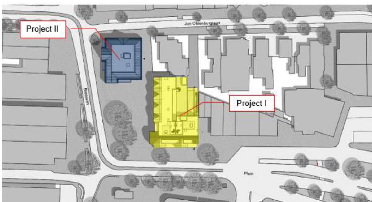
Figuur 4. Impressie van beide voorgestelde projecten