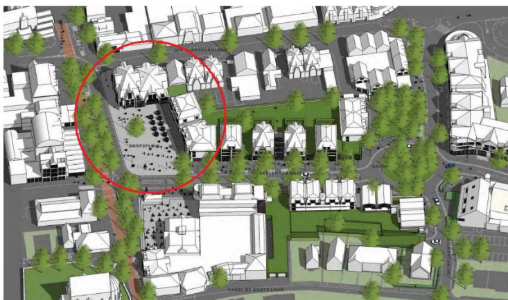
Figuur 2. Impressie uit mooi Bergen 1.0